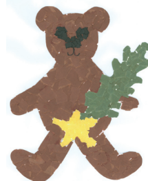
Svenja aus Thüringen