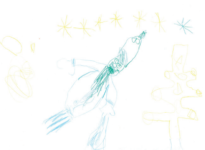
Nele aus Schleswig-Holstein