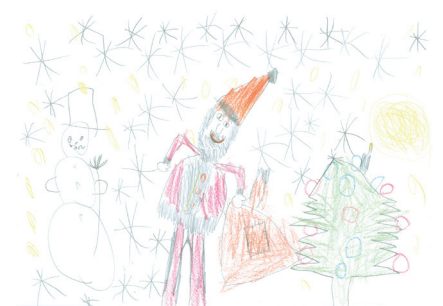
Larisa aus Schleswig-Holstein