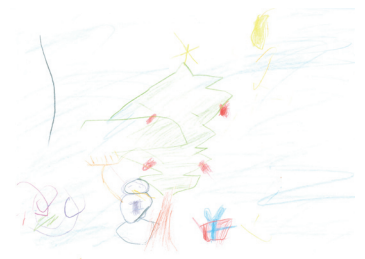
Jasmin aus Nordrhein-Westfalen