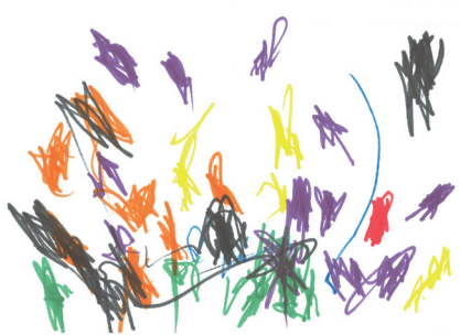
Lars aus Nordrhein-Westfalen